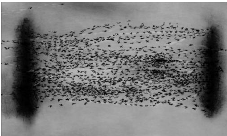
El libro es el mejor aliado del conocimiento

net, fortalecida gracias a la posibilidad de actualizarse constantemente. Hoy, una década después, los libros electrónicos o textos digitales son la materia prima con la que los docentes arman sus clases en las aulas virtuales. El libro, más allá de su forma, continúa siendo ese puente que hay que cruzar para dejar atrás el desconocimiento. En ese sentido, Julio Arévalo y José Córdón (2015) aseveran que explicar un texto exclusivamente por su forma material sería absurdo y se correría el riesgo de incurrir en un simplismo. Para ellos, la aparición de las tecnologías de información electrónica cambió radicalmente el concepto del libro.