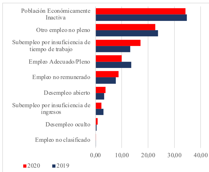
Gráfico 2 Porcentaje - Condición de actividad 2019-2020

Fuente: ENEMDU (2019 - 2020) -INEC Elaboración: Propia